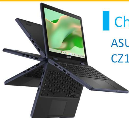
Chrome OS ASUS Chromebook CZ12 Flip