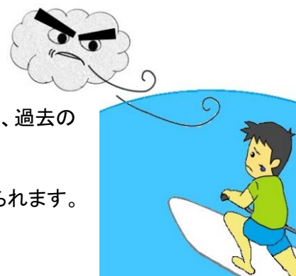
水難事故の発生場所、風向・風速